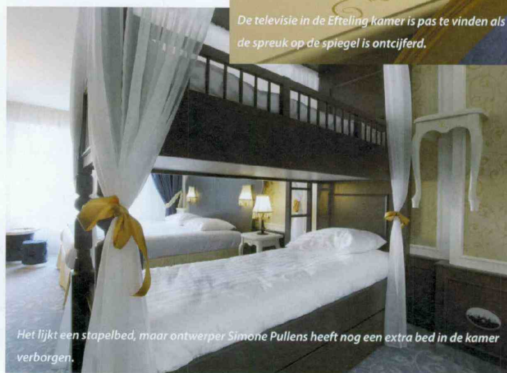
Het lijkt een stapelbed, maar ontwerper Simone Pullens heeft nog een extra bed in de kamer verborgen.