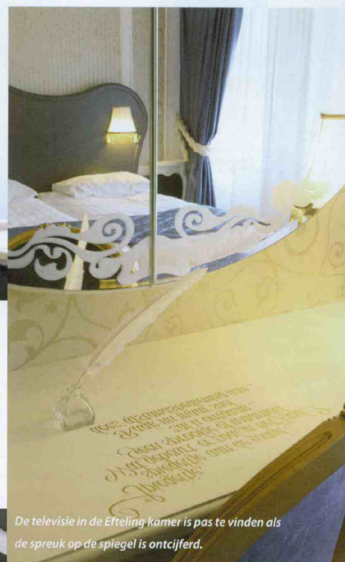
De televisie in de Efteling kamer is pas te vinden als de spreuk op de spiegel is ontcijferd.

visie op de willen hebben. Er is op de kamer wel degelijk een televisie, maar die moet je activeren door een spreuk onder de spiegel te ontcijferen. Ook is er een bordspel ontwikkeld op een poef. Met dit bordspel worden de kleinste bezoekers uitgedaagd om verborgen sprookjeselementen in de kamer te ontdekken. De hemelstapelbedden in de vier- en vijfpersoonskamers zijn uitgerust met een 'verborgen bed'. Er valt nog veel meer te ontdekken, maar Pullens wil niet alles prijsgeven. "Ik heb vorige week in het hotel geslapen met mijn neefje van negen jaar," vertelt Pullens, "hij vond het geweldig om alles te ontdekken en zelf ben ik ook erg enthousiast over het resultaat. Het mooie van de hele operatie is overigens, dat er door de creatievelingen van de Efteling maar weinig aan mijn beginontwerp is veranderd."